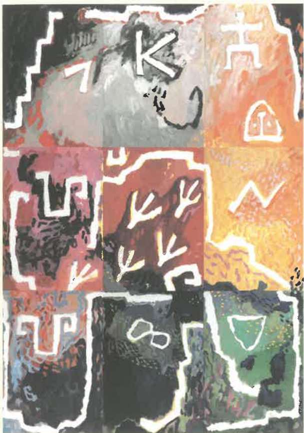
Iris Pagano de Dornier „Lied an Südamerika“