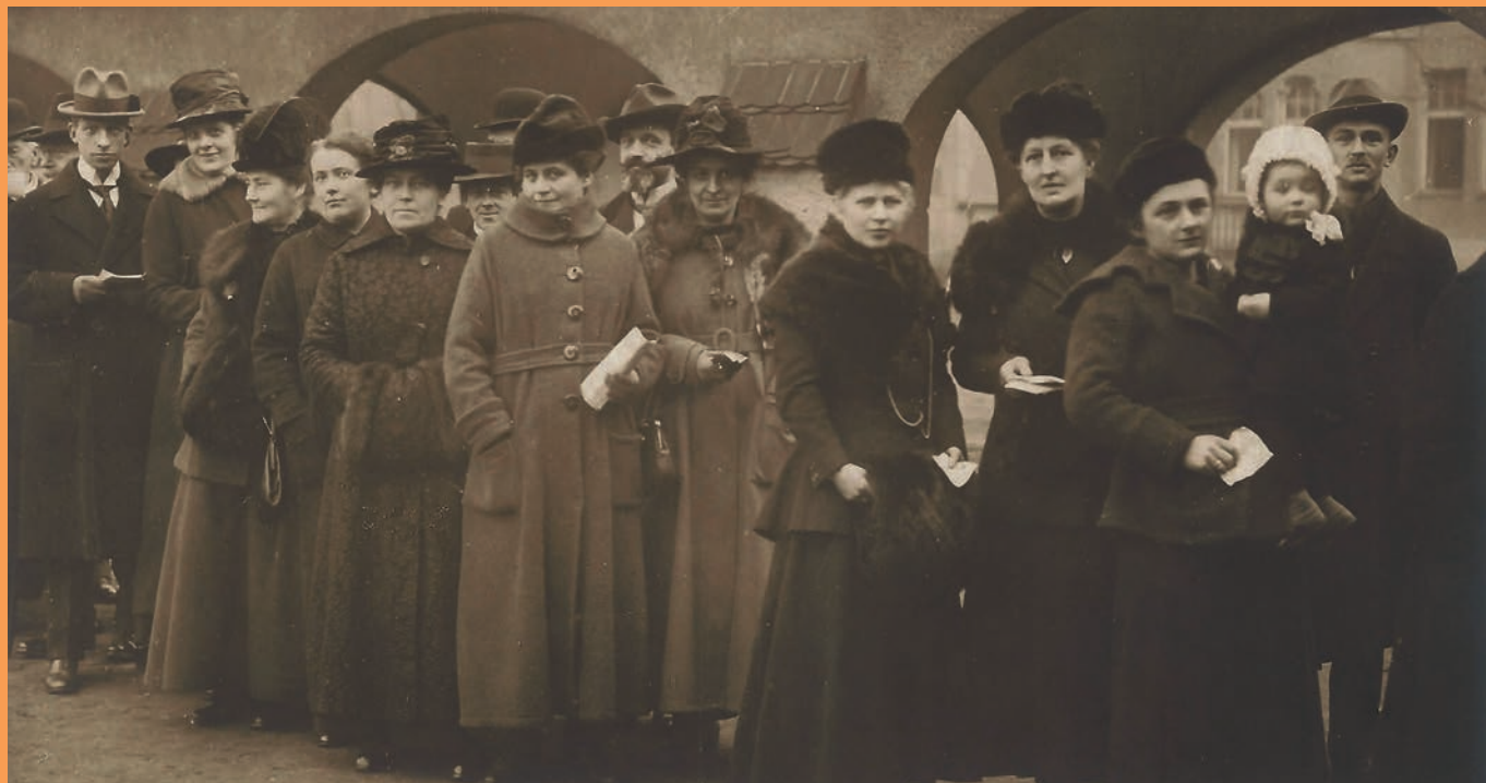
Warteschlange vor einem Wahllokal zur Wahl der Nationalversammlung 1919