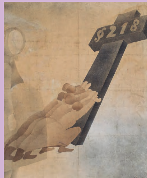
Alice Lex-Nerlinger, §218