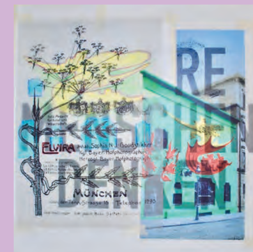
Fotoatelier Elvira, Collage v. Corinna Heumann 2018